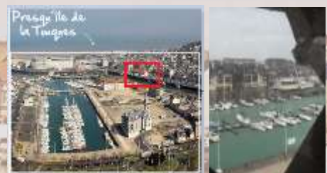
Photo de droite prise du beffroi lors de notre visite fin 01/2016.

⇒ Zoom sur Les Jardins d'Eugénie – Deauville (14) : ce programme prestigieux se situe sur la presqu'île de la Touques dont le site fait l'objet d'un projet de construction et de rénovation d'envergure. Du studio à la maison de type F5.