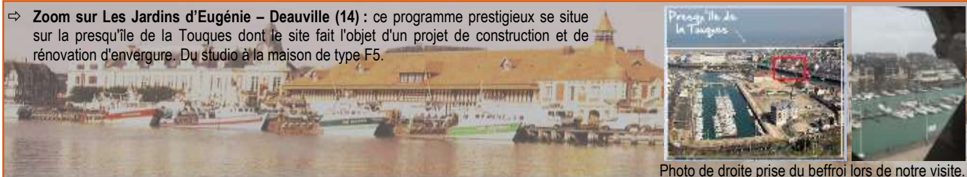
Photo de droite prise du beffroi lors de notre visite.

⇒ Zoom sur Les Jardins d'Eugénie – Deauville (14) : ce programme prestigieux se situe sur la presqu'île de la Touques dont le site fait l'objet d'un projet de construction et de rénovation d'envergure. Du studio à la maison de type F5.